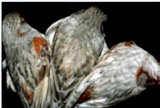
Canarios Bronce pastel

Los canarios negro-brunos influenciados por la mutación "pastel" han perdido parte de su estructura feomelánica, por lo que las marcaciones negras del dorso y de los flancos deben aparecer sin sus características sombras feomelánicas. Son considerados óptimos, pues aquellos ejemplares que carecen totalmente de ella.