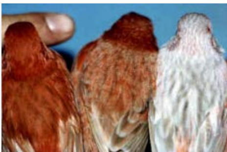
Canarios Isabela rojo intenso, nevado y mosaico

Como en todos los ejemplares de base roja el defecto más importante, es la presencia de plumas insuficientemente pigmentadas o completamente amarillas, así como el exceso de pigmentación, manifestado por un tono amarronado y carente de brillo.