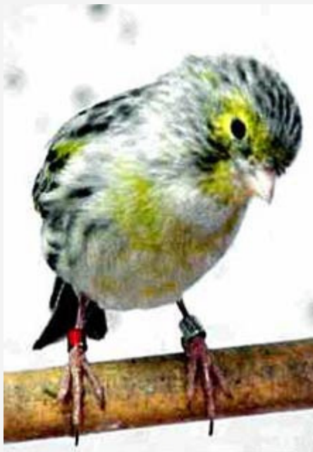
Ágata amarillo Mosaico

El defecto principal de esta variedad, es la tendencia al rojo.