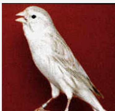
Canario Isabel Plata

A estos ejemplares por ser "platas", se les otorga la máxima puntuación en el apartado de "categoría"