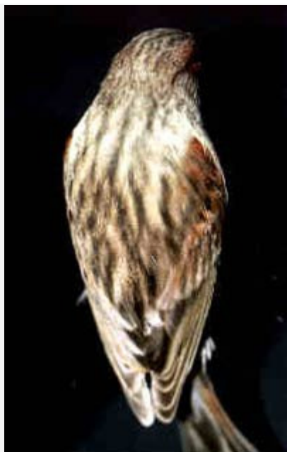
Canario Bruno Rojo Mosaico

El defecto más importante, como en todas las variedades de base roja, es la presencia de plumas insuficientemente pigmentadas, o completamente amarillas, siendo los hombros la zona donde más se aprecia este defecto, por ser estas las plumas que primero mudan. También debe tener penalización el exceso de pigmentación, que se manifiesta por un tono granate oscuro carente de brillo.