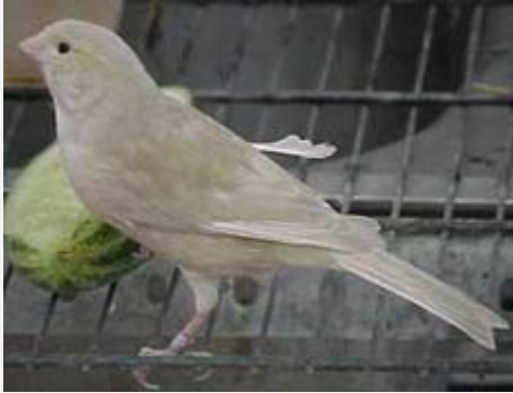
Canario Bruno Pastel Marfil Nevado

Sus principales defectos son: la ausencia total de dibujo dorsal o de los flancos, con tendencia al Isabela pastel, la presencia de feomelanina lo cual viene expresado por un manto de tonalidad de color ocre o rojizo, zonas diluidas en alas y cola semejantes al carácter "alas grises" o al de dilución del ágata o Isabela.