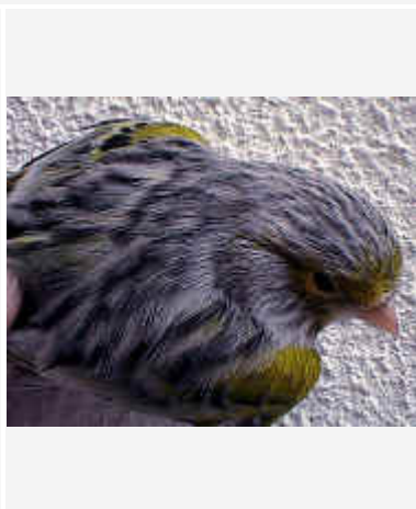
Ágata amarillo mosaico