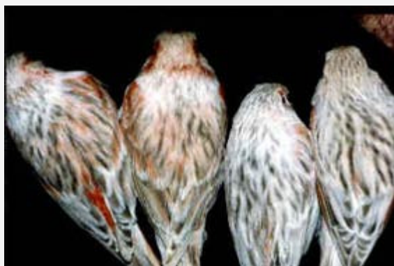
Canarios Ágatas Pasteles

Cuando la mutación pastel aparece sobre un canario ágata, la débil estructura feomelánica de este, se ve sensiblemente reducida por el factor pastel, hasta casi desaparecer en algunos sujetos que son los considerados óptimos. En ellos únicamente queda la estructura eumelanina negra con una aureola de dilución producida por la mencionada ausencia casi total de feomelanina. Dicha dilución es muy patente en alas y cola que, al igual que el dibujo melánico dorsal es de un tono gris perla. Dicho dibujo melánico es más estrecho que el del negro-bruno pastel y debe ser limpio y concreto. El pico, las patas y las uñas quedan también muy esclarecidos y casi de color piel el subplumaje es gris.