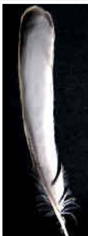
Pluma Remera Alas Grises

Con esta denominación englobamos una serie de negro-bruno pastel influenciados por una particular dilución en las alas y cola. El carácter de los "alas grises" es una mutación de reducción melánica que afecta exclusivamente a los canarios negro-brunos pastel. Se caracteriza fundamentalmente por la extrema dilución que presentan las plumas remeras y timoneras en su parte central que aparece de una tonalidad gris acerada con las puntas de las plumas negras. Esta circunstancia debe ser claramente patente incluso con las alas y la cola bien cerradas.