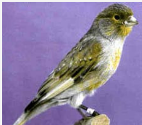
Canario verde mosaico pastel (macho)