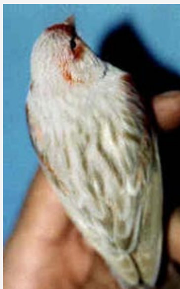
Canario Isabela rojo mosaico (macho)

Como en todos los ejemplares de base roja el defecto más importante, es la presencia de plumas insuficientemente pigmentadas o completamente amarillas, así como el exceso de pigmentación, manifestado por un tono amarronado y carente de brillo.