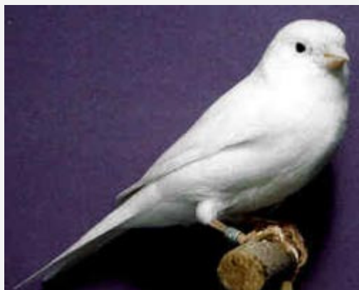
Canario Blanco recesivo

El aspecto de estos canarios es de un blanco nítido, sin que en ningún lugar pueda apreciarse resto alguno de lipocromo, hasta el punto de que su piel tiene una tonalidad azulada, al no poder colorear la grasa subcutánea.