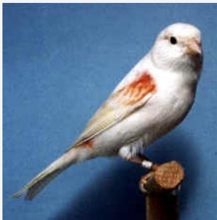
Canario Rojo Mosaico Hembra