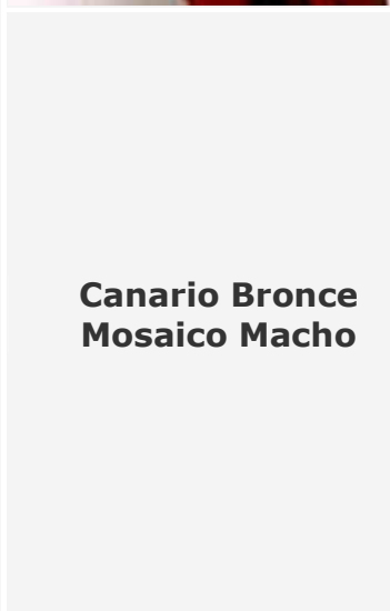
Canario Bronce Mosaico Macho