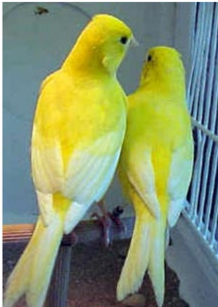
Canarios Amarillo Intenso