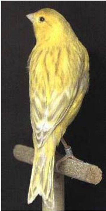
Isabela amarillo Intenso

Insistiendo en los cruces de estos machos con hembras ágatas o brunas, en algún momento determinado y seguramente favorecido por alguna circunstancia especial no determinada, se produjo el fenómeno de "crossing-over" o "entrecruzamiento" de genes entre cromosomas, dando lugar a la inversión de posición de "z" por "z+" o "rb", quedando la composición genética del nuevo ejemplar, de la forma siguiente: