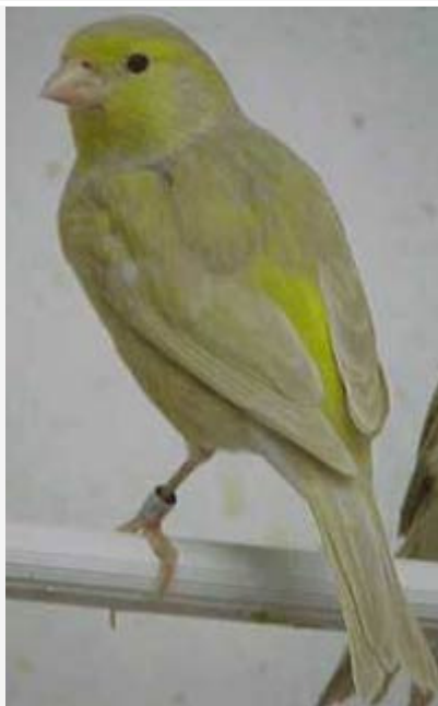
Canario Bruno Pastel Plata

La acción que la mutación pastel ejerce sobre el canario bruno clásico da como resultado una notable reducción de la estructura feomelánica y la dispersión de la eumelanina, por lo que el dibujo eumelánico queda sensiblemente reducido de tamaño. El aspecto general del canario es de un tono marrón oscuro con un mínimo de dibujo en el dorso, en la cabeza, y en los flancos. Las plumas de las alas y cola no deben presentar zonas diluidas, sino que toda la pluma debe estar "llena" de melanina marrón. El pico, las patas y las uñas deben ser de color piel y el subplumaje color marrón.