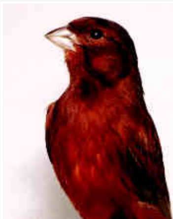
Canario Bronce Intenso

El defecto más acusado es la presencia de pequeñas plumas insuficientemente pigmentadas, o totalmente amarillas, principalmente en los hombros. Este defecto ocurre cuando se comienza a dar colorante después de haber empezado la muda en el ejemplar.