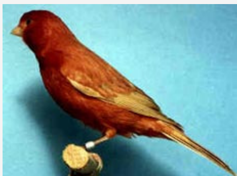
Isabela rojo Intenso

Resumiendo: el dibujo debe ser nítido y contrastado, del color de la cáscara de nuez, o sea marrón muy claro y debe apreciarse limpio el lipocromo del dorso entre las estrías.