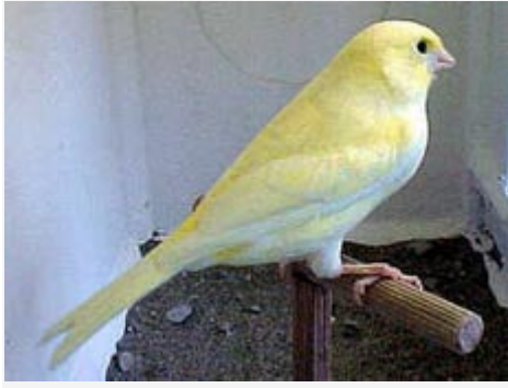
Canario Amarillo Marfil Nevado