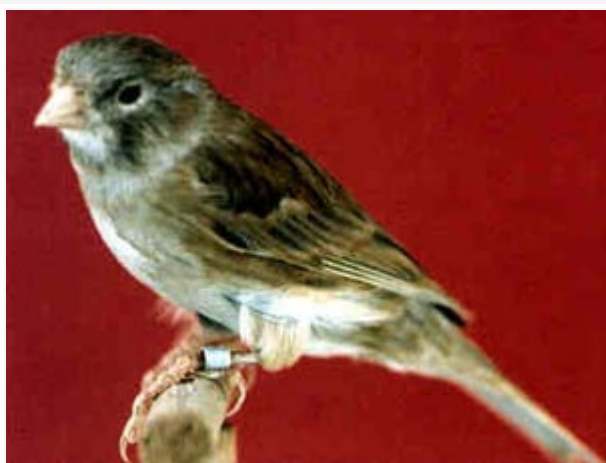
Canario Bruno Plata

Por ser de fondo plata, a estos ejemplares se les otorga la máxima puntuación en el apartado de "categoría".