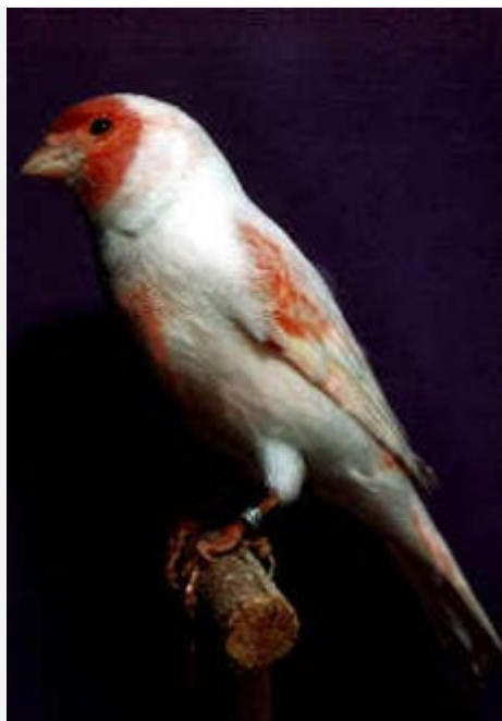
Canario Rojo Mosaico Macho

Este color rojo será brillante y uniforme.