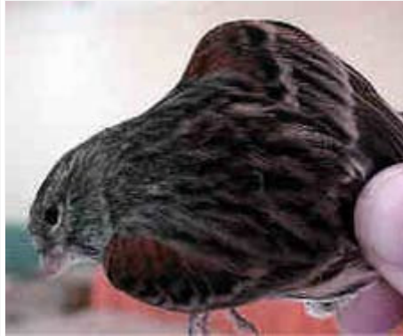
Bronce Mosaico Hembra