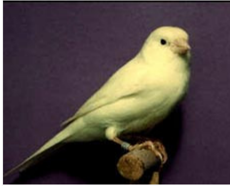
Canario Amarillo Marfil Intenso

Son principales defectos, la tendencia al factor rojo, y el exceso de dilución en el lipocromo, que le hace presentar una tonalidad blanquecina.