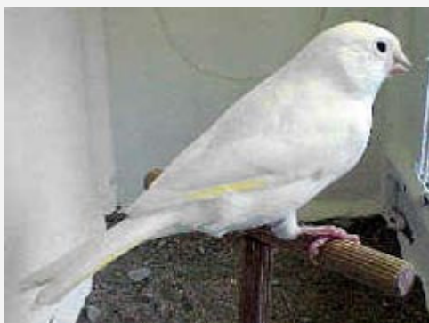
Canario Blanco Dominante

Si estos restos de lipocromo tienden al rojo, deben ser penalizados, llegando a la descalificación si este defecto fuera muy acusado.