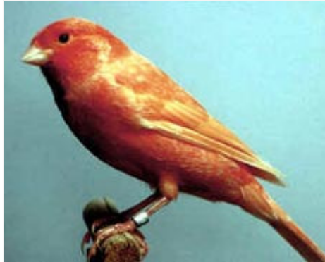
Canario Rojo Nevado