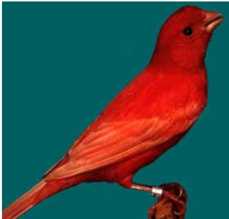
Canario Rojo Intenso

Por hibridación con el Cardenalito de Venezuela, el canario amarillo hereda la facultad de asimilar, los pigmentos rojos, consecuencia directa de este fenómeno es la aparición del factor rojo en canaricultura.