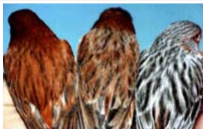
Canarios Ágata rojo Intenso, Nevado y Mosaico

El color de fondo de este ejemplar será ligeramente gránate, por efecto de la superposición al rojo de los restos de eumelanina negra dispersa, este color se apreciará perfectamente en el pecho y entre el dibujo melánico del dorso, será uniforme y brillante.