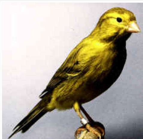
Ágata amarillo intenso

Por ser una variedad diluida, la eumelanina negra dispersa debe ser mínima, por lo que el lipocromo amarillo de fondo mezclado con muy poca eumelanina negra nos dará un tono amarilloverdoso, que destacará claramente entre el dibujo melánico del dorso y el pecho.