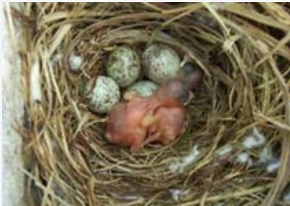
Pichones de 2 días

Gusanos de la Harina (larvas de Tenebrio monitor ), aproximadamente 30 larvas diarias por cada pichón, por supuesto también contaban con el pastón ACRU con huevo y el resto de los alimentos. Los pichones fueron anillados perfectamente a los 6 - 7 días con anillos de 2,8 mm., que por precaución los cubrí con una tira fina de "curita" color piel para que pasen más desapercibidos y así evitar que los padres en un intento de eliminar el anillo tiren algún pichón del nido o le lesionen la pata. Luego de probar en una segunda nidada a dejar los anillos al descubierto y comprobar que esta hembra ignoraba ese cuerpo extraño, no tuve necesidad del camuflaje.