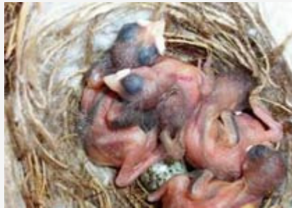
Pichones de 4 días