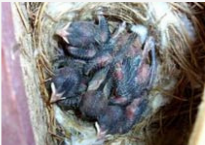
Pichones de 8 días