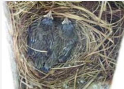
Pichones de 14 días

Los pichones abandonan el nido a los 15 - 16 días de vida, y este es un momento crítico si se está criando en monogamia con ambos miembros de la pareja juntos, y más aún si la jaula no tiene rejilla divisoria, ya que el macho puede atacar a los pichones. Por este motivo retiraba el macho de la jaula de cría inmediatamente que los pichones salían del nido o luego de la postura de la hembra dejando a ésta sola a cargo de la incubación y la crianza.